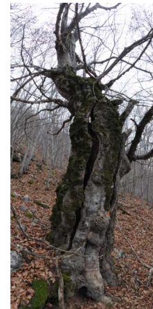
Vieil arbre creux