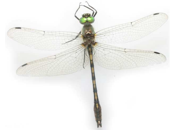
Libellule de taille moyenne (abdomen de 33 à 39 mm et ailes postérieures de 24 à 36 mm). Yeux contigus, thorax entièrement vert métallique, sans bandes jaunes. Abdomen noirâtre avec des taches jaunes bien visibles. Ailes parfois légèrement teintées de jaune à la base (mâle), ou plus ou moins grisées (jeune mâle, femelle).